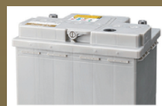
補水不要の液口栓

*3 日本国内の補修市場に流通している自動車用電池において。(当社調べ2022年6月時点)